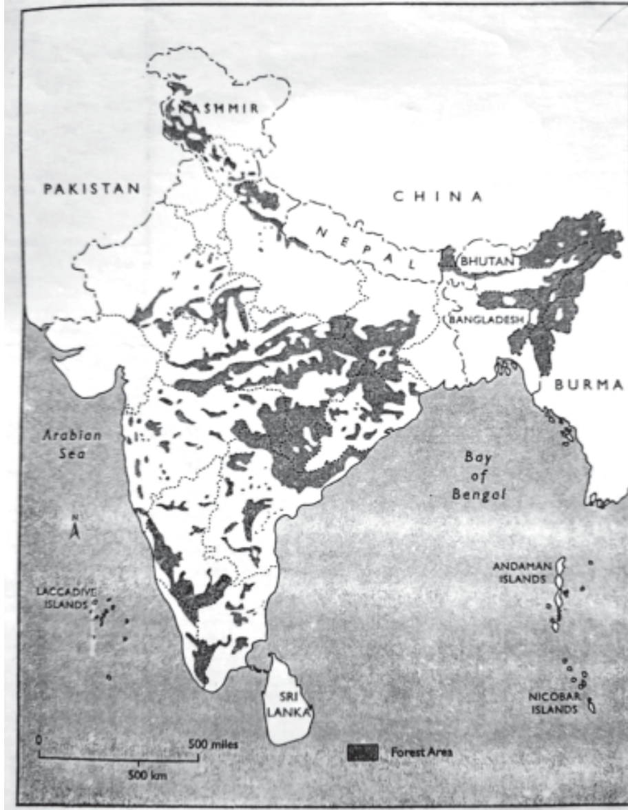
Figure 1.1 : India's forests

શ્રી ડી. સી. કેઈથ દ્વારા દર્શાવેલા કોઠાઓમાં સમગ્ર ભારત દેશનાં રાજ્યોમાં ફરતી ખેતી જે વિસ્તારોમાં થાય છે તેનો સંયુક્ત અને પછી રાજ્યવાર ફરતી ખેતીની વિગતોને આપવાનો પ્રયાસ થયો છે તે જોઈએ.