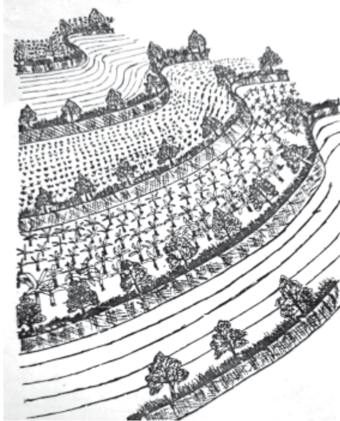
પગથિયા ખેતીને સુધાર